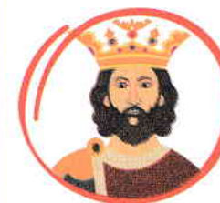
Mircea cel Bătrân

❖ A introdus gratuitatea și obligativitatea învățământului primar.