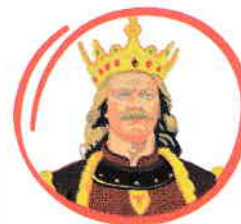
Ștefan cel Mare

A reușit să-și apere țara de ocupația turcilor.