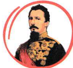
Alexandru Ioan Cuza

Domn al Țării Românești (sec. al XVI-lea)